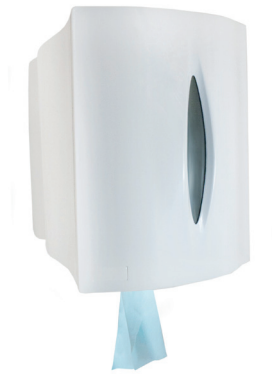
Ref. 06500 Dispensador mecha para rollo Microlitex.

“La información aparecida en esta Ficha Técnica se tiene como cierta y correcta. No obstante, la exactitud total de esta información así como cualquier sugerencia o recomendación se hace sin garantía. Dado que las condiciones de uso están más allá del control de nuestra empresa, es responsabilidad del usuario determinar las condiciones para un uso seguro de este producto.”